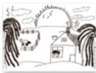
Pasaje de Primaria a Secundaria