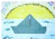
Pasaje de Primaria a Secundaria